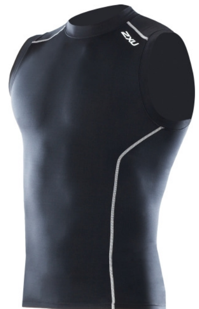
Die 2XU-Rennempfehlung: Sleeveless Compression-Top

Über 2XU: Die australische Marke 2XU, sprich [tu: taims ju:], setzt Maßstäbe bei Sportfunktionsbekleidung und Neoprenanzügen durch den Einsatz innovativer Technologien und Materialkombinationen. 2XU Compression definiert neue Standards bei Compression-Sportbekleidung. Internet: www.2xu.com