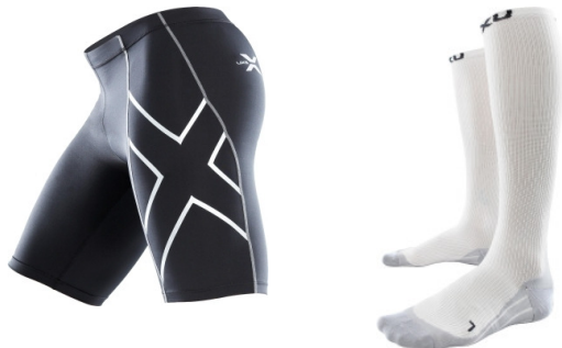
Die 2XU Compression Short & 2XU Compression Race Socks